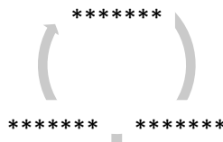
Рис.1. Название рисунка